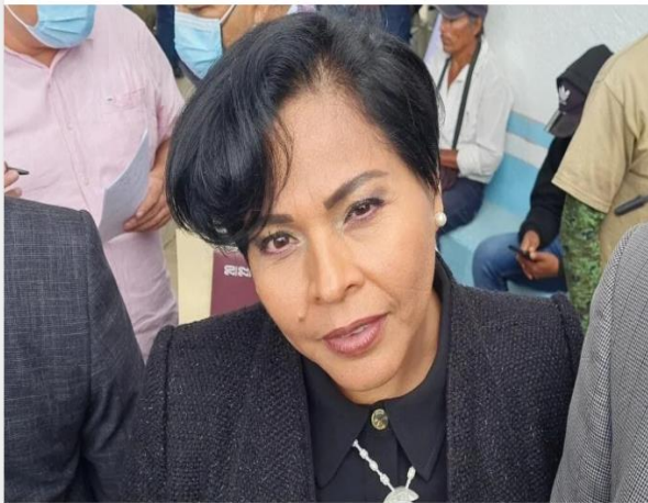
La fiscal general del estado de Guerrero, Sandra Luz Valdovinos Salmerón, anunció que tanto la Fiscalía General del Estado como la Fiscalía General de la República están llevando a cabo una investigación sobre la presidenta municipal de Chilpancingo, Norma Otilia Hernández Martínez, después de la difusión de un video en el que se le ve reunida con un presunto narcotraficante y discutiendo sobre temas de seguridad.

Jul 13, 2023 #Chilpancingo, #Fiscalía General del Estado, #Gobierno municipal, #Guerrero, #Norma Otilia